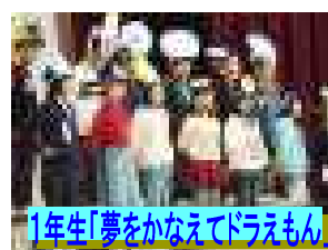
1年生「夢をかなえてドラえもん」