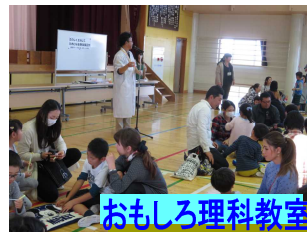
おもしろ理科教室