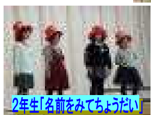
2年生「名前をみてちょうだい」