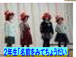
2年生「名前をみてちょうだい」