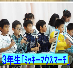
3年生「ミッキーマスマーチ」