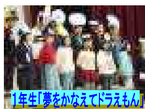
1年生「夢をかなえてドラえもん」