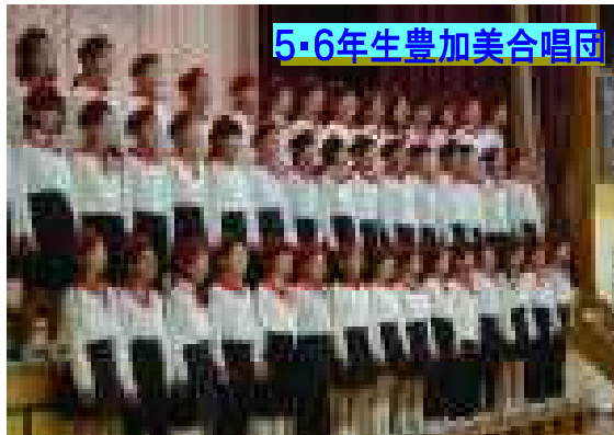
5・6年生豊加美合唱団

11月3日(金)に実施しました「三世代交流豊っ子フェスティバル」には、たくさんの方々に来校していただき、感謝申し上げます。発表会では、園児から6年生までの発表を行いました。子供たちは、前から何回も練習したり、いろいろと準備したりしてきましたが、その成果を十分発揮することができました。保護者の皆様には、温かいご声援を