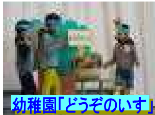
幼稚園「どうぞのいす」

ありがとうございました。午後は、おもしろ理科教室を楽しみ、最後は緊急時園児・児童引き渡し訓練を行いました。