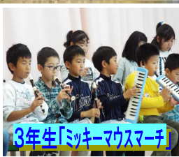
3年生「ミッキーマスマーチ」