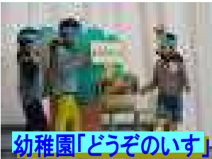
幼稚園「どうぞのいす」

ありがとうございました。午後は、おもしろ理科教室を楽しみ、最後は緊急時園児・児童引き渡し訓練を行いました。