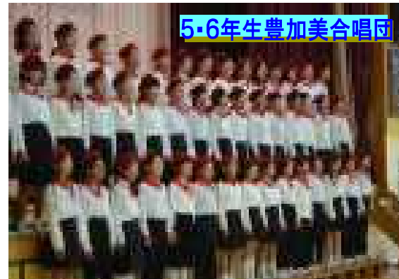
5・6年生豊加美合唱団

んの保護者や地域の方々に来校していただき、感謝申し上げます。発表会では、園児から6年生までの発表を行いました。子供たちは、前から何回も練習したり、いろいろと準備したりしてきましたが、その成果を十分発揮することができました。保護者の皆様には、温かいご声援を