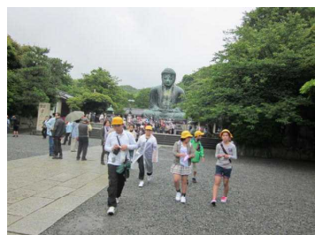
鎌倉見学（班別行動）

6月8日、9日と一泊二日の日程で修学旅行を実施しました。1日目の鎌倉見学の時には、少し小雨が降っていましたが、子どもたちが考えたコースを自分たちの力で見学できたことに大きな満足感をもつことができました。2日目の「富士急ハイランド」では、友だちとなかよく楽しむことができ、充実した2日間を過ごすことができました。