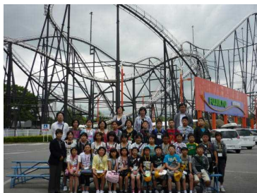
2日目の富士急ハイランド（班別行動）