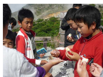
大涌谷での黒たまご