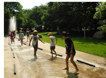
気持ちよかった水遊び