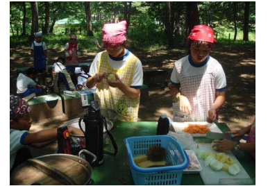
野外でカレーライスづくり