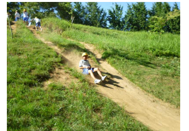
泥にまみれた芝すべり

眠い目をこすりながらも、早起きをして始まった2日目。冷房で冷えきったプラネタリウムホールで、星の世界を味わいました。アウトドアの自然とインドアで鑑賞した宇宙の世界。子どもたちからは、感動の声がたくさん聞かれました。その後は、茨城県自然博物館(ミュージアムパーク)に移動して、グループごとに見学・体験活動を行いました。化石掘りに挑戦して、見事ゲットした子。水の広場で気持ちよく水遊びを楽しんだ子どもたち。時間を忘れて、最後のプログラムを満喫しました。