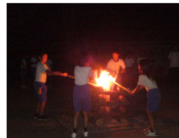
キャンプファイヤーの始まり

1日目のメインイベントは、夜のキャンプファイヤー。PTAの役員さんたちも大勢見に来てくださる中、厳かな点火の式を行いました。営火係のメンバーは、緊張の中にも堂々とした態度で点火に臨んでいました。第2部はレクリエーション。学級の歌を歌ったり、フォークダンスを楽しんだり、最後には花火をして、火にまつわる行事を締めくくりました。