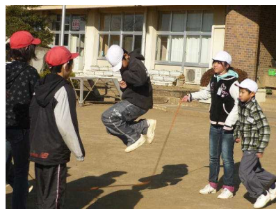
休み時間、元気に遊ぶ子どもたち